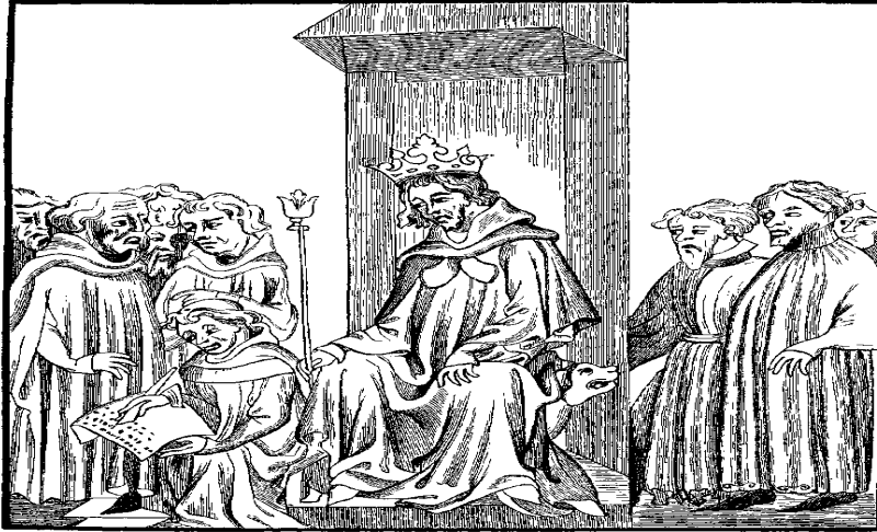
Слика бр.1 : Читање прве верзије Салијског закона у присуству владара Клодовика