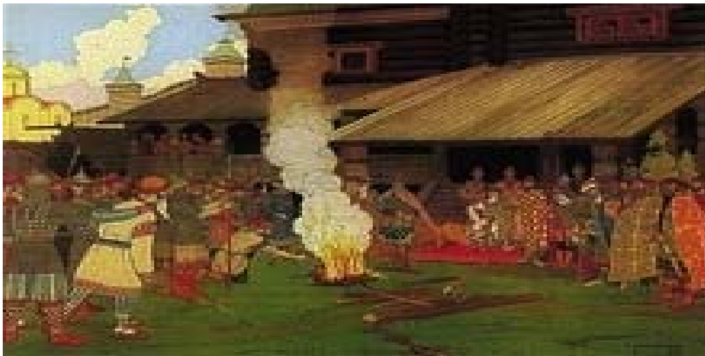
Слика бр.5: Извршење пресуде у доба Кијевске Русије

Већ у десетом веку појавила су се ограничења поводом крвне освете и заживео је откуп, тако да обавеза сродника да освете убијеног поприма обресе реликта прошлости. Убиство као тежак грех по хришћанским учењима довело је до тога да појединци више немају право и терет кажњавања па држава преузима тај задатак уз свест о томе да је крвна освета кривично дело изједначено са убиством које је предмет освете.