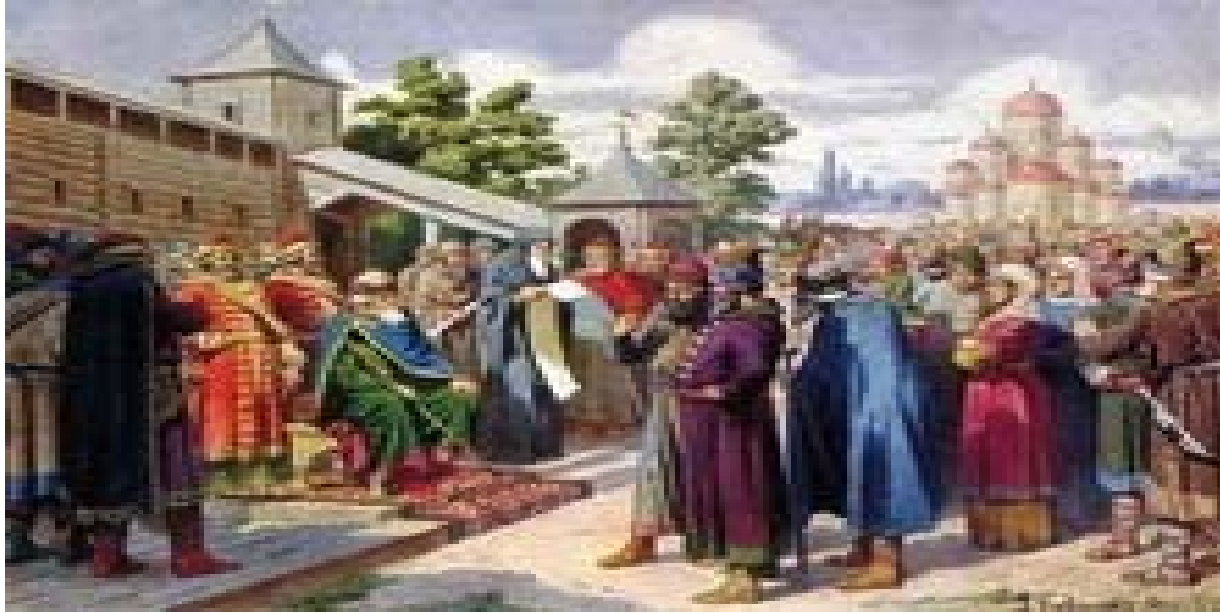
Слика бр.2 : Јавна читања Руске правде у присуству кнеза Јарослава