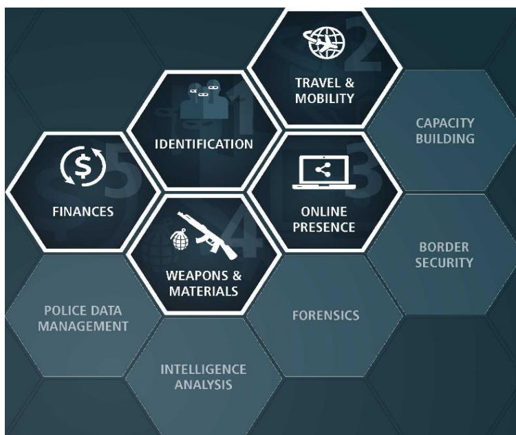
Слика бр. 1 Пет токова акција Интерпола 52

Да би Интерпол започео акцију борбе против терористичког дела од пресудног значаја је препознавање кривичног аспекта одређеног дела, не узимајући у обзир верску, расну или политичку конотацију тог дела. Овакав став је дефинисан у Интерполовој Резолуцији бр. 6/1984 где је одређено да је политички карактер неког дела у надлежности те државе и у њеном домаћем законодавству.