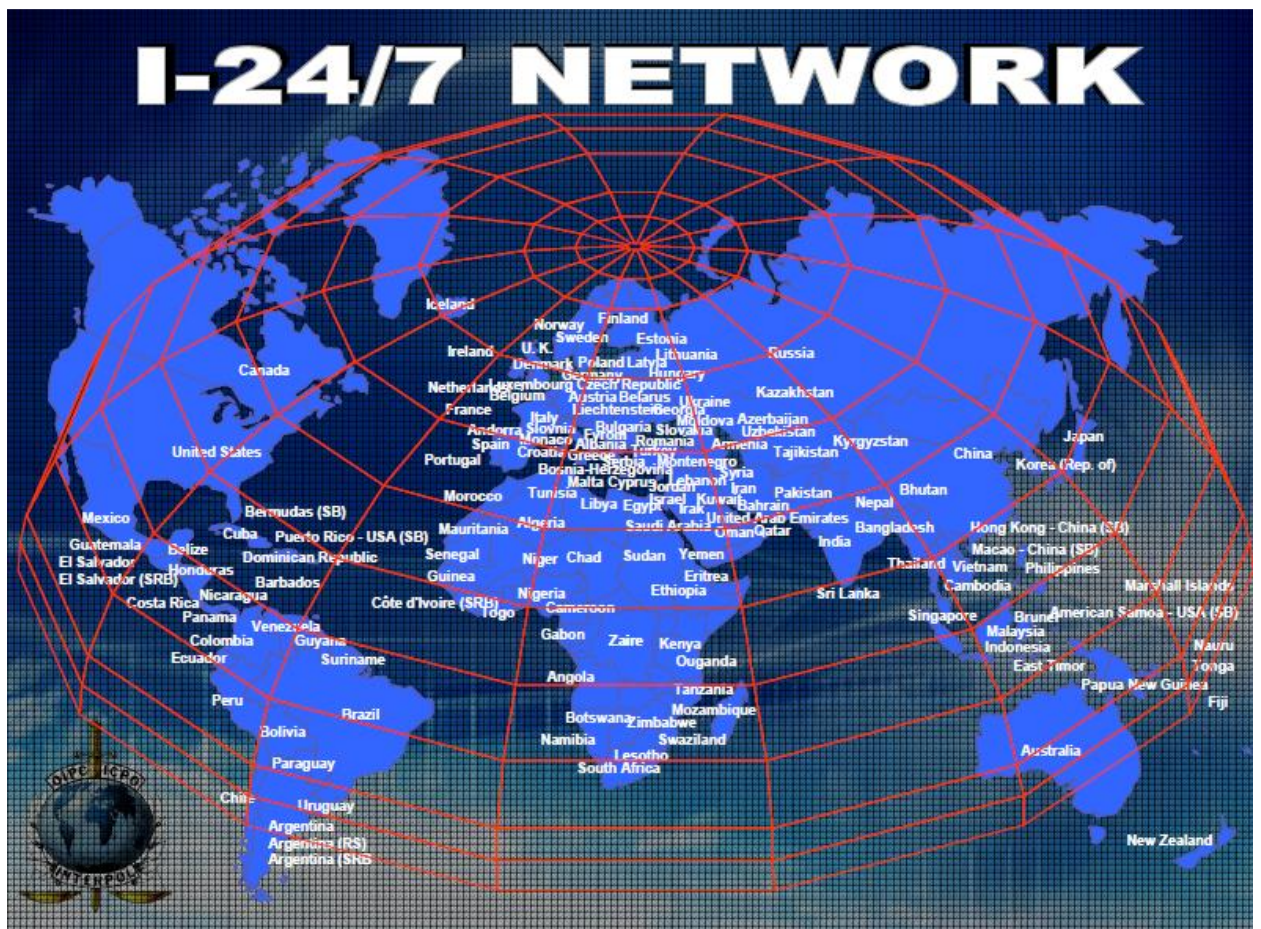
Слика бр. 2 Интерполова сигурносна комуникациона мрежа I-24/7 56

хапшења сумњивих лица у целом свету, за спречавање међународних путовања и кретање новца чланова терористичких група и поседовање оружја. Постоје и „ наранџасте књиге “ 55 које указују на кривична дела пролиферације оружја или на савремене моделе тероризма, „ плаве књиге “ које служе за праћење појединаца који се могу повезати са криминалом, „ зелене књиге “ упозорења и подаци о тешким криминалцима, „ жуте књиге “ о несталим лицима, „ црне књиге “ о идентификовану преминулих (лешева), „ Интерполове посебне књиге “ о индивидуама које су повезане са Ал Каидом и Талибанима, и особе којима је „замрзнута“ имовина и забрањено путовање.