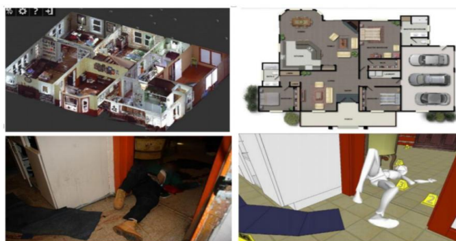
Слика 4. 3Д модел куће креиран употребом Faro Focus 3D (горе лево), 2Д нацрт спрата креиран коришћењем традиционалних метода (горе десно), фотографија тела на месту злочина (доле лево) и 3Д реконструкција у складу са претходном фотографијом (доле десно)

Уређај се не може користити у неповољним временским условима попут кише, снега и суснежице. Такође не може правилно да створи огледала или површину воде, јер ове рефлексујуће површине имају тенденцију да поремете путању ласера. Међутим, грешке изазване рефлексирајућим површинама могу се исправити током фазе обраде. Пространост статива може отежати употребу уређаја у малим просторима. Иако се уређај може користити у мраку, он не може фотографисати тачне фотографије у недостатку природне или вештачке светлости. Међутим, мерења прикупљена у мраку и даље се могу користити за стварање 3Д модела околног окружења.