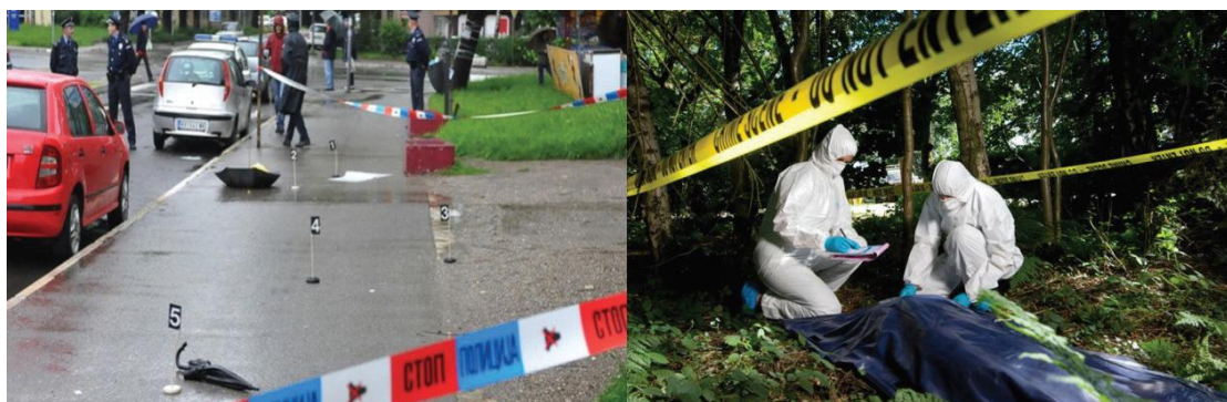
Слика 2. Правилно вршење увиђаја (обезбеђено лице места)

Криминалистички гледано, лице места представља и свако место на коме могу да се пронађу носиоци материјалних или личних информација о неком догађају, трагови и предмети који су релевантни при разјашњењу догађаја, односно идентификација предмета и особа. Увиђаји са лица места јесу најбитнији извори материјалних макро и микро трагова и предмета кривичног дела, као и осталих информација које су релевантне. Због тога, битно је да се лице места обезбеди од стране полицијских службеника.