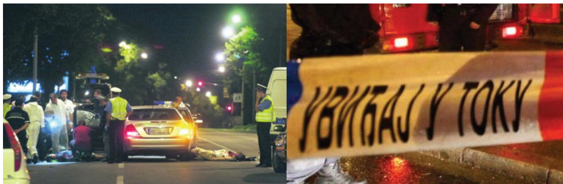
Слика 1. Неправилно вршење увиђаја (необезбеђено лице места)

Појам лица места представља простор у оквиру кога се нешто догодило, где се дешавала радња, збивања, акције, то јест догађаји који се на основу својих карактеристика могу да се подведу као нека радња која је законом недопуштена и кажњива. 29